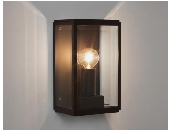
CODE: 1095040 FINISH: TEXTURED BLACK

THIS PRODUCT IS NOT SUITABLE FOR INSTALLATION WITHIN FIVE MILES OF THE COAST. FOR THESE ENVIRONMENTS, PLEASE FILTER PRODUCTS ON THE ASTRO WEBSITE BY 'COASTAL'.